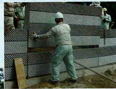
コンクリートスキンは、高さ1.2m×幅2.7mの長方形。従来のテールアルメにはないサイズと形になった。表面には深いデザインが施されている

スーパーテールアルメの施工性が高いわけは、コンクリートスキンのサイズと形状に隠されている。標準タイプの形状は高さ1.2m、幅2.7m、厚さ14cmで、1枚当たりの重量は約1.2t弱。使用する施工機械を始め、工事の手順や工程を変えることなく、壁面設置時間の大幅短縮が実現された。コンクリートスキンを長方形にしたことで、従来現場打ちだったコンクリート部分もプレキャスト製品の使用が可能となった。