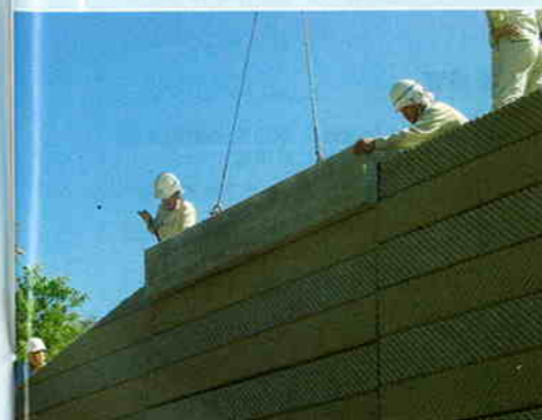
天端周りの施工状況。勾配に合わせて製作した最上段のコンクリートスキンにキャップをかぶせれば天端のレベルはそろそろ。ブラケット足場が不要になり、現場打ちコンクリートは最小限で済むようになった

現場打ちコンクリートを最小限に減らす。これもスーパーテールアルメが実現した施工の合理化の一つだ。