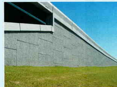
アメリカでの実績例

補強材の最適配置に伴い、盛土層厚にも変更が加えられた。一般的な国内基準の上限値である30cmとすることにより、施工時間の短縮が図られている。山梨の試験施工では約5mの盛土構築であったが、従来20層となるところが16層となり、盛土作業は大幅に改善した。